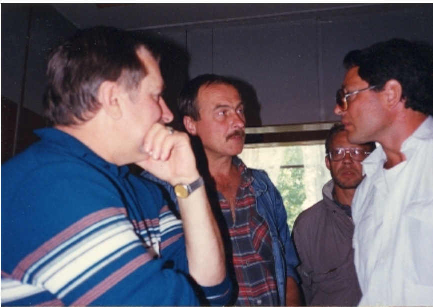
Walesa-6: Danzica, Agosto 1988, Ligi Cal, assistito dall'interprete, ancora a colloquio diretto con Walesa all'interno dei cantieri. Annota Cal sul retro della foto: “Walesa scopre-sorpreso- che la Cisl e pochi altri sindacati nel mondo non lo hanno dimenticato”.