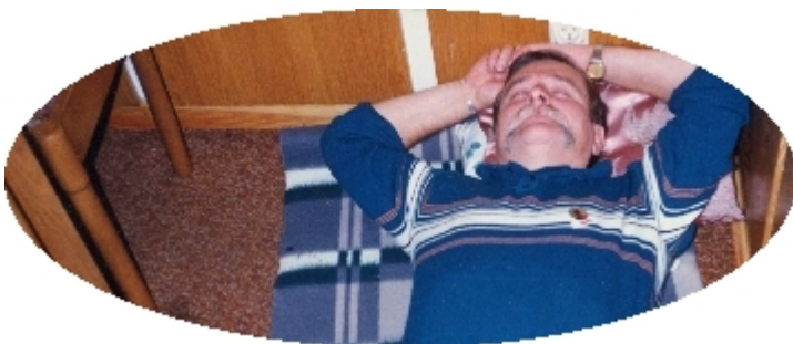
Walesa-4: Danzica , agosto 1988. Il riposo

Luigi Cal durante la sua visita clandestina ai Cantieri navali in lotta. Cal è andato dentro i cantieri occupati per portare la solidarietà e l'amicizia della Cisl a Walesa e agli altri operai di Solidarnosc, che con la loro lotta stanno cambiando la Polonia e portano democrazia e libertà dal comunismo. Qui, sempre all'interno, spiega il suo ingresso clandestino al picchetto di guardia agli storici cancelli con l'assistenza dei suoi amici polacchi che l'hanno aiutato ad entrare. Luigi Cal, che era andato a Danzica dopo aver concordato il piano con Tadeus Konopka, rappresentante di Solidarnosc a Roma, non era entrato dai cancelli, ma saltando rocambolescamente da un muro periferico dei cantieri con l'aiuto di un paio di complici, di cui uno indicatogli da Tadeusz Mazowiecki, che egli aveva incontrato la sera prima, al suo arrivo, nella canonica della Parrocchia dei cantieri.