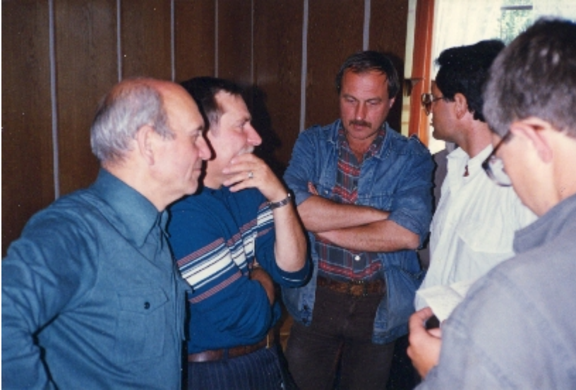
Walesa-5: Danzica, Agosto 1988 (interno cantieri navali). Walesa ascolta Luigi Cal, che è venuto a portargli la solidarietà della Cisl e anche notizie dal mondo sindacale e politico internazionale.

prima che lo svegliassero ho scattato la foto. Appena aperti gli occhi Walesa si è stropicciato un pò e allargando le braccia mi ha salutato con un 'mamma mia'. Le uniche parole che sa dire ancora oggi in italiano e che mi ha sempre ripetuto ogni volta che negli anni successivi ho avuto l'occasione di incontrarlo”.