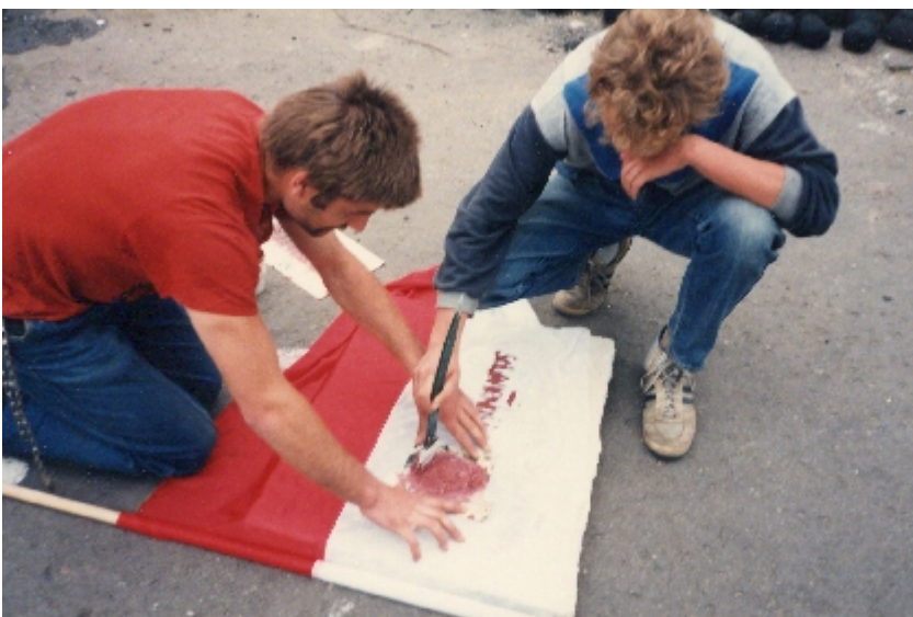
Walesa-2: Danzica, Agosto 1988: Luigi Cal, entrato clandestinamente nei Cantieri navali di Danzica occupati dal sindacato Solidarnosc, fondato e guidato da Lech Walesa, porta la solidarietà della Cisl ai lavoratori