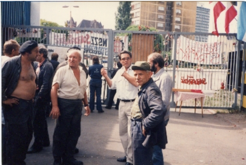
Walesa-3: Danzica , Agosto 1988.

polacchi in lotta. Appena scavalcato il muro di cinta s' imbatte su due giovani lavoratori in sciopero che dipingono sulla bandiera polacca il famoso logo di Solidarnosc.